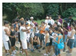
Parque de Pituçu