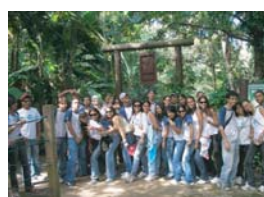
Área de Preservação Ambiental Coelba