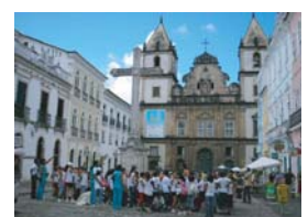
Centro Histórico de Salvador