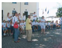
Cidade de Cachoeira

O objetivo da aula de campo é proporcionar ao aluno um contato direto com o objeto de estudo, seja ele histórico, geográfico, ambiental ou cultural. Essa atividade promove, além da aprendizagem do conteúdo, a integração do grupo, o respeito aos diversos ambientes, e principalmente o prazer de aprender.