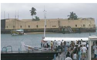
Forte São Marcelo