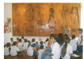
Museu de Etnologia